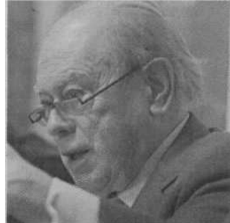
Jordi Pujol, ayer en Terrassa.

Jordi Pujol, ex presidente de la Generalitat, pronunció ayer una conferencia en la sede de Cecot, invitado por el Club de Màrqueting. Jordi Pujol llamó a los empresarios a "recuperar el orgullo de país, sin fanfarronerías poco inteligentes" y abogó por redefinir los objetivos nacionales de Catalunya, en un discurso trufado de alusiones a Terrassa, PÁGINA 14